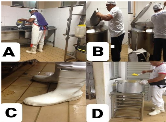
Figura 3. Colaboradores

Pode-se perceber que não há material EPI suficiente para colaboradores tornando a atividade mais perigosa como a cocção, matérias como aventais térmicos, proteção para os olhos e protetor auditivo são disponibilizados pela empresa, porém há uma grande resistência do uso principalmente pelos colaboradores com mais tempo de serviço prestado a empresa. Ao notar a imagem B observamos que avental térmico disponibilizado pela empresa não tem aceitação da equipe devido material, após algum tempo de uso,